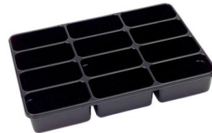
Separador ORSY 100