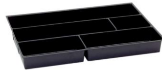
Separador ORSY 100